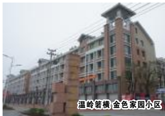
温岭曙横金色家园小区

金色家园住宅小区建筑面积近8万平方米,由6幢小高层和18幢多层组成,共计商品房552套,2009年年初即已全部售出。